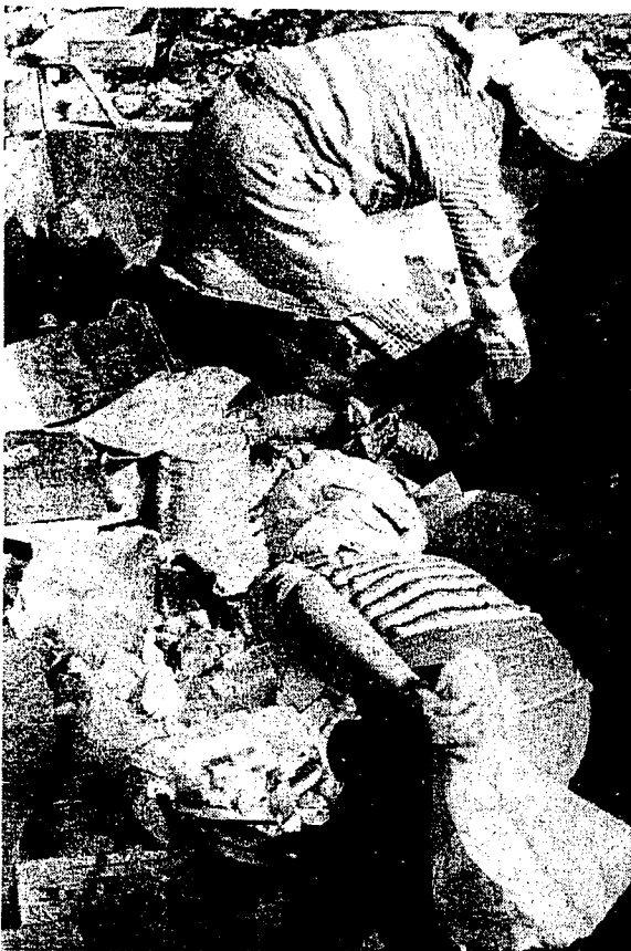
graaien in ons vuil.....