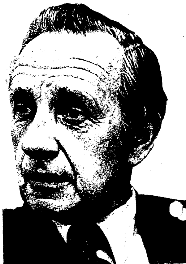
Brian Urquhart, plaatsvervangend Secretaris Generaal van de Verenigde Naties

De plaats-vervangend Secretaris Generaal van