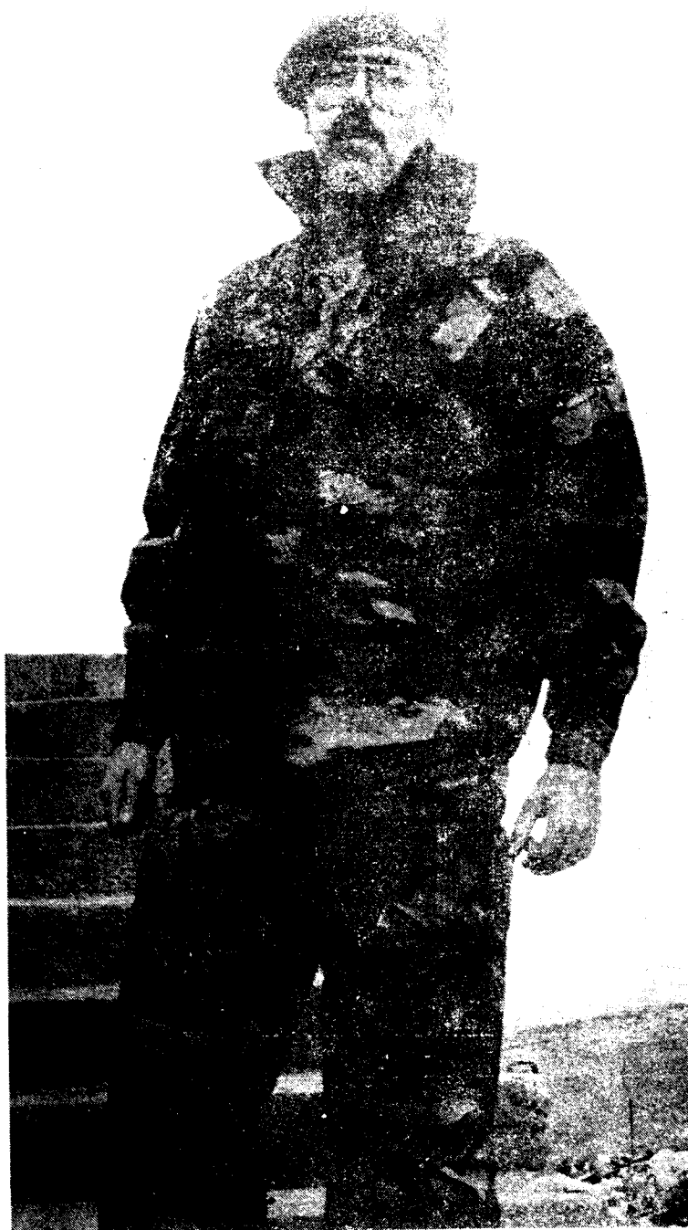
De nieuwe regenkleiding die nu binnen is.