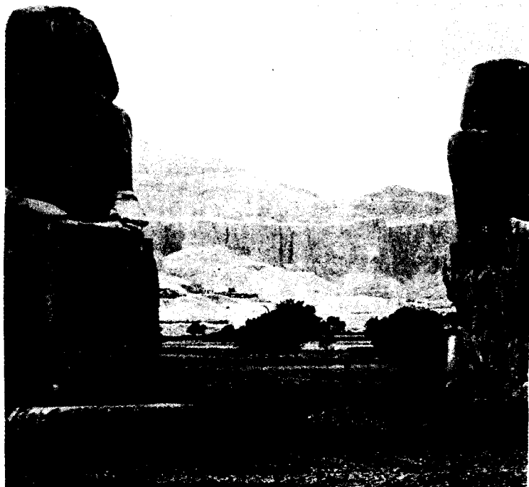
De Memnon-kolossen langs de weg naar het Dal der Koningen in Thebe

Luksor is een goed uitgangspunt voor interessante tochten. Naar het bananeneiland, naar het gigantische tempelcomplex van Karnak en naar de dodenstad aan de overzijde van de Nijl. Voor nog geen pond huur je een fiets om al peddelend de mooiste plekjes langs te gaan. Luksor zelf kent vele goede hotels. Op het terras van "Chez Farouk" schuin tegenover de tempelingang (Amenophis III) heb je een mooi uitzicht op het dal der Koningen en op een kleurige zonsondergang.